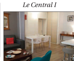
Le Central I